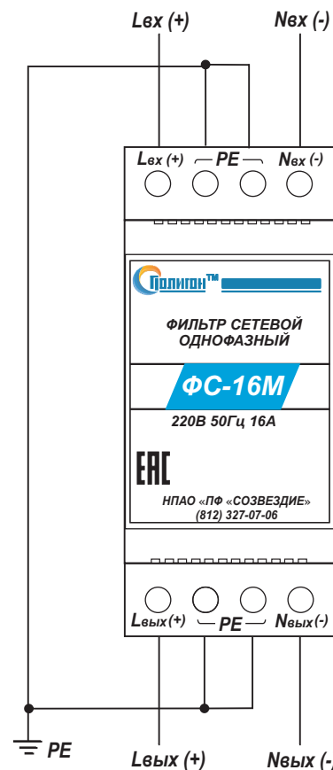
Рис.1. Порядок подключения фильтра ФС-16М.